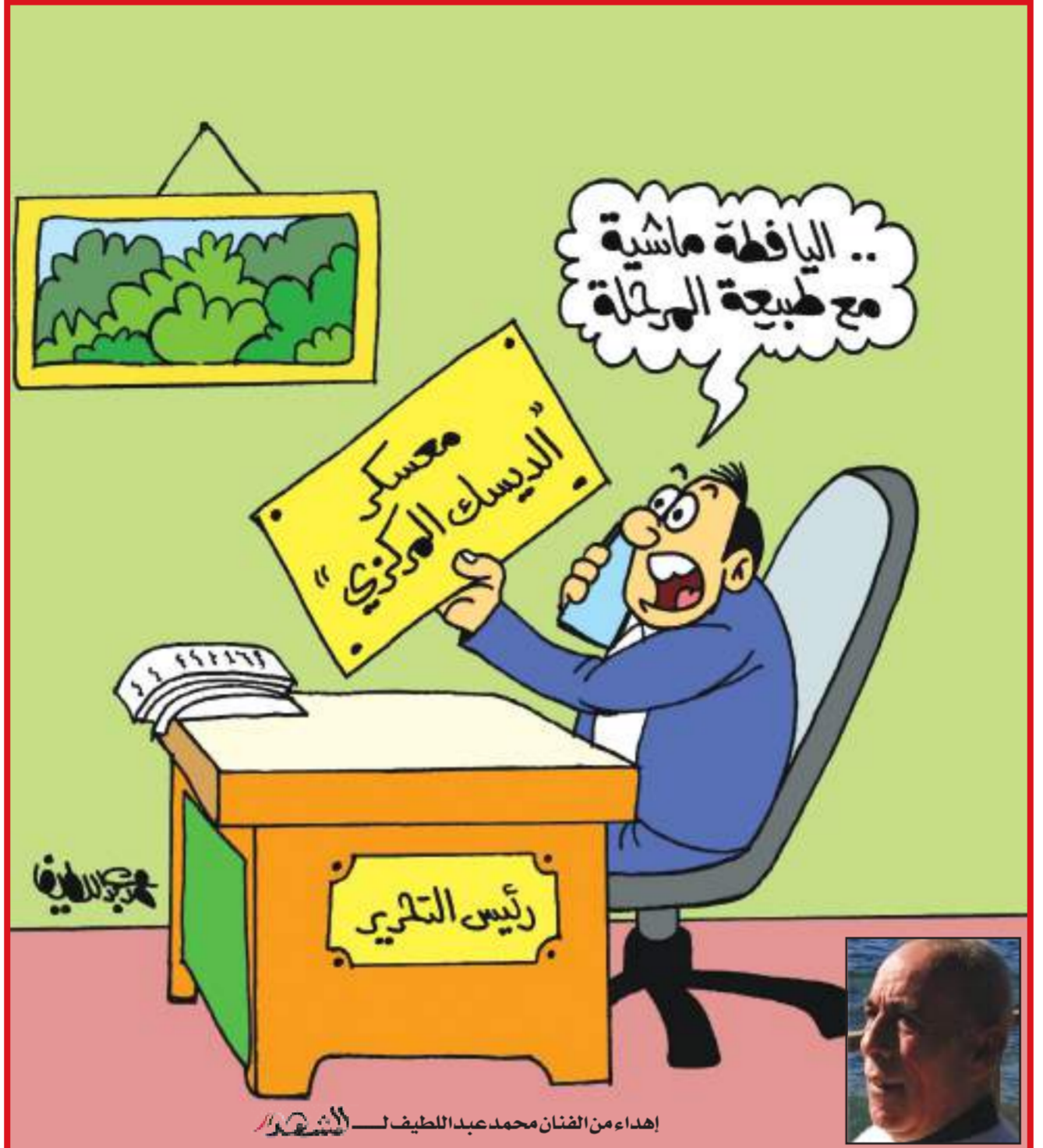
إهداء من الفنان محمد عبد اللطيف

العدد 350 - السنة الرابعة عشرة - الأربعاء - 15 أبريل 2026 م - 27 شوال 1447 هـ