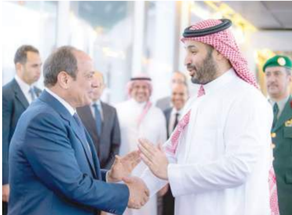
ولي العهد السعودي يستقبل الرئيس المصري في زيارة دعم وتضامن وسط حرب إيران

يحكم سلوك الدولة في زمن الحرب ، وكذلك سلوك باقي الدول المتحاربة حيالها ، ويستند إطارها القانوني على اتفاقيات لاهاي ١٩٠٧ و قواعد القانون الدولي الإنساني ، وأيضاً ميثاق الأمم المتحدة (وإن كان بشكل غير مباشر وفي ظل قيود معينة) . وهذا "الحياد" القانوني ، ملزم قانونياً ، ويُطبق أساساً في حالة نزاع مسلح قائم ، ويتضمن حقوقاً وواجبات واضحة ، ومن أهم التزامات الدولة التي تعلن حيادها بشكل قانوني ملزم هي : عدم المشاركة في الحرب ، عدم دعم أي طرف عسكرياً ، منع استخدام أراضيها لأغراض عسكرية ( والمثال البارز هو حالة سويسرا ) .